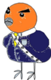
生徒会キャラクター「わごうどり 若人鳥」