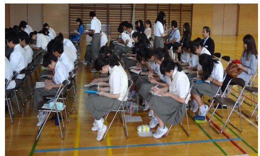
発表後に司会者が聴衆の中に入り感想、意見を確認し、質疑応答をスムーズにします。