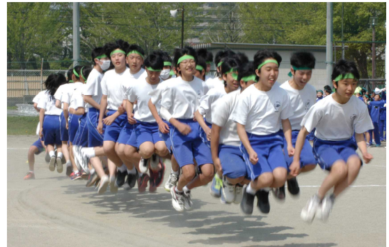
気持ちを一つに、ジャンプ！（スポーツ大会）

さて、先週土曜日に、授業参観、学年PTA、学級懇談があり、明日はその振替休業日ですので、実質的には、明日から8月21日までの夏休みとなります。「夏休みの生活心得」をもう一度確認し、充実した夏休みにしてほしいと思います。33日間は1年間の12分の1の長さです。この期間を有意義に過ごすためにも、小さな目標を立て、1つずつ達成していきたいものです。22日から中総体県大会、24日は吹奏楽コンクール地区大会です。健闘を期待します。また、夏休み明けには附中祭、駅伝、合唱祭とありますが、元気な姿で登校することを楽しみにしています。