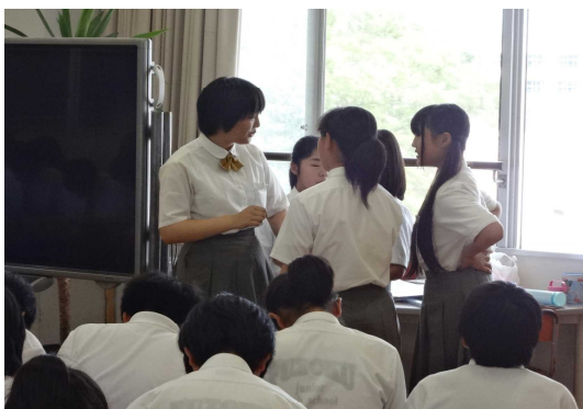
発表後に質問への準備（2年、函館酪農公社）